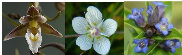
Moeraswespen orchis Parnassia

9. Langs dit pad zijn enkele stuifkuilen te zien. Deze kuilen ontstaan wanneer de wind vat krijgt op een stukje zand zonder vegetatie er op. De wind blaast het zand weg en na verloop van tijd stort de rand van de ontstane kuil, al dan niet begroeid, in elkaar. Door dit proces kunnen de stuifkuilen uitgroeien tot enorme valleien. Deze valleien kunnen zo diep worden dat het grondwater aan de oppervlakte komt. Wanneer dit gebeurt ontstaan natte duinvalleien. Deze natte duinvalleien herbergen enkele zeldzame en zeer fraaie plantensoorten. In de natte duinvalleien die in deze zone van Meijendel liggen groeien onder andere de vleeskleurige orchis, de moeraswespen orchis en parnassia . Tevens is hier de rugstreeppad te vinden. Op de hellingen rondom de duinvalleien is de kruisbladgentiaan te vinden. Deze plant is Nederland zeer zeldzaam en is vrijwel alleen in dit duingebied te vinden. U kunt hier bij zonnig weer tevens ook de zandhagedis tegen het lijf lopen.