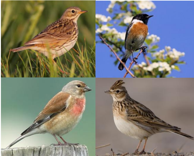
Kneu en veldleeuwerik .

Vogelsoorten die hier thuishoren zijn de graspieper , roodborsttapuit ,